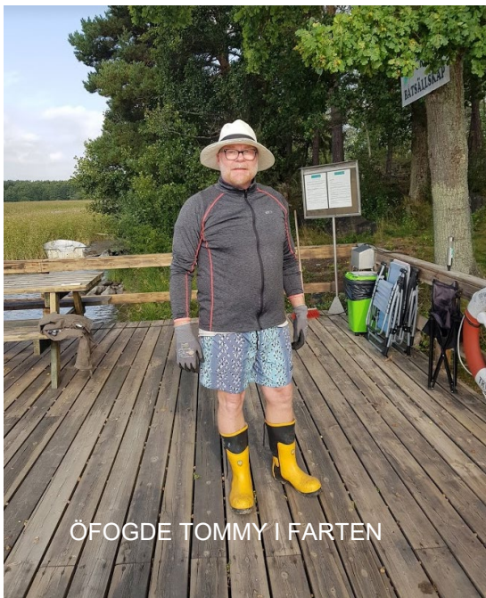
ÖFOGDE TOMMY I FARTEN