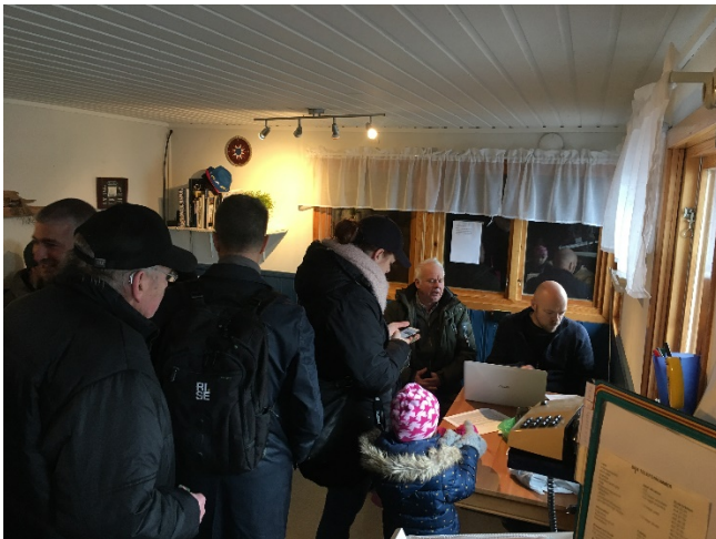
VIP öppning 2019

Som ni alla vet så är avloppslangen dragen. En hel del arbete återstår med att koppla in pumpen och dra alla rör som ska kopplas från toalett, dusch och köket i klubbhuset. Den nya tanken med pump kommer att finnas i verkstaden där den gamla toatanken var.