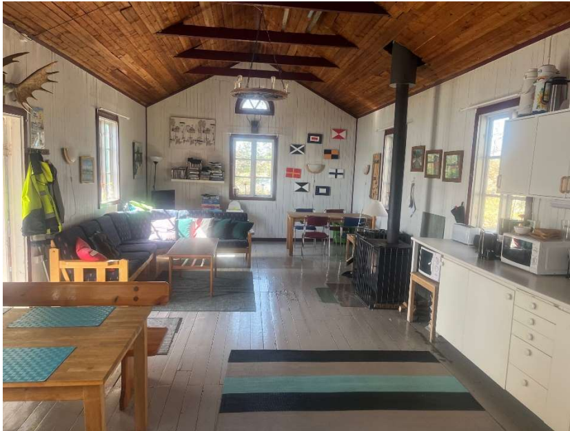
Storstugan är städad och i ordning inför sommaren.