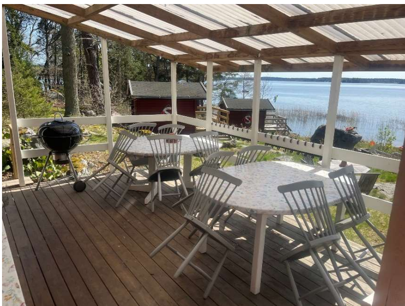
Altan med utsikt

I en av uthyrningsstugorna på klubbholmen är det tillåtet med husdjur.