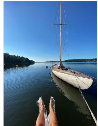
förra årets vinnarbild

Ta din fina sommarbild från april till september och skicka till klubbmastare@gbs.nu sen lägger vi ut din bild utan namn på Facebook. Är bilden i liggande format kan vi även använda den på vår webb. Tillsammans med medlemmar röstas vinnarbild fram. Vinnare och vinst meddelas på årsmötet.