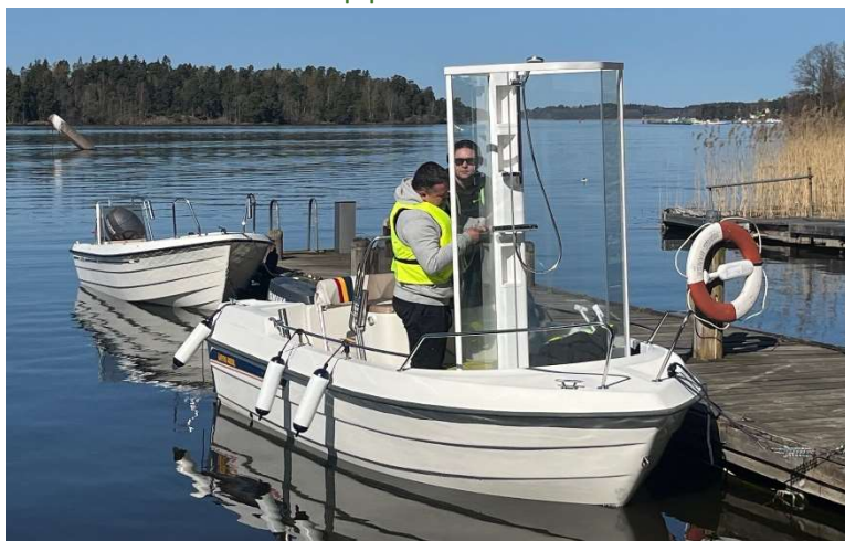
Den blivande duschkabinen anländer med båt