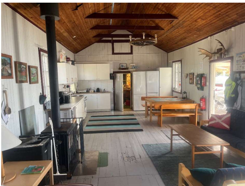
Storstugan med köket längst bort

Det kommer finnas anslag i hamnen och på holmen om vilka dagar och tider det är arbetspass. Och även när arbetet med bryggan pågår.